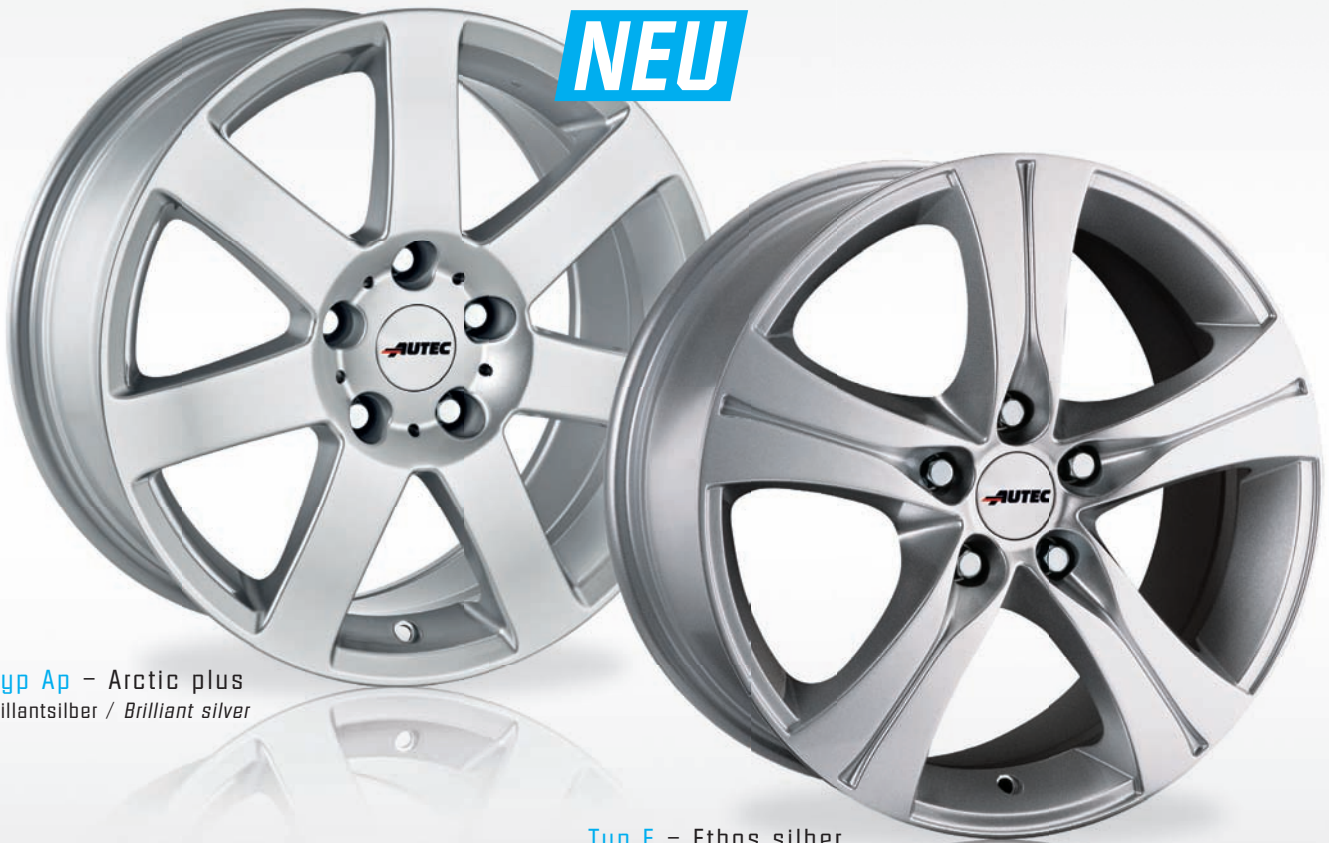
Typ Ap – Arctic plus Brillantsilber / Brilliant silver