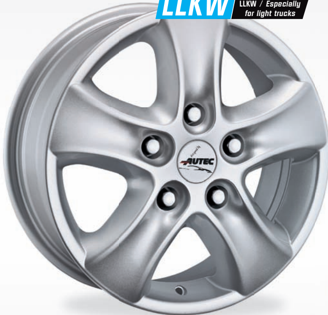
Typ T – Talos Brillantsilber / Brilliant silver

LLKW Speziell für LLKW / Especially for light trucks