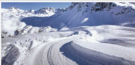
Typ N - Nordic Brillantsilber / Brilliant silver