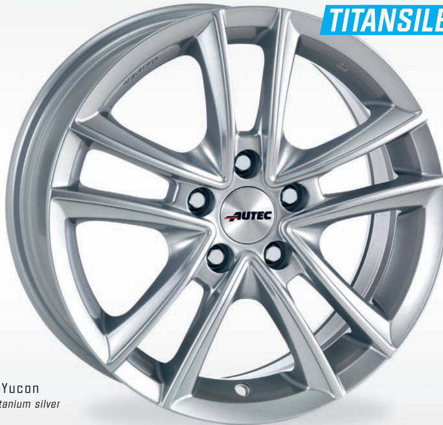
Typ Y - Yucon Titansilber / Titanium silver