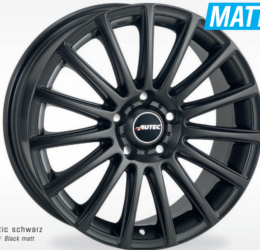
Typ F – Fanatic schwarz Schwarz matt / Black matt