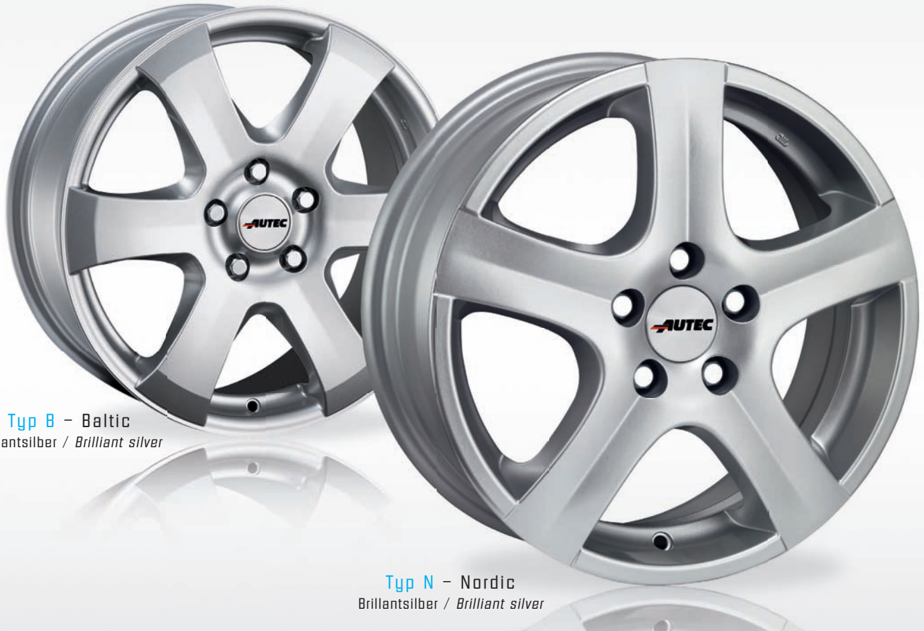
Typ B - Baltic Brillantsilber / Brilliant silver