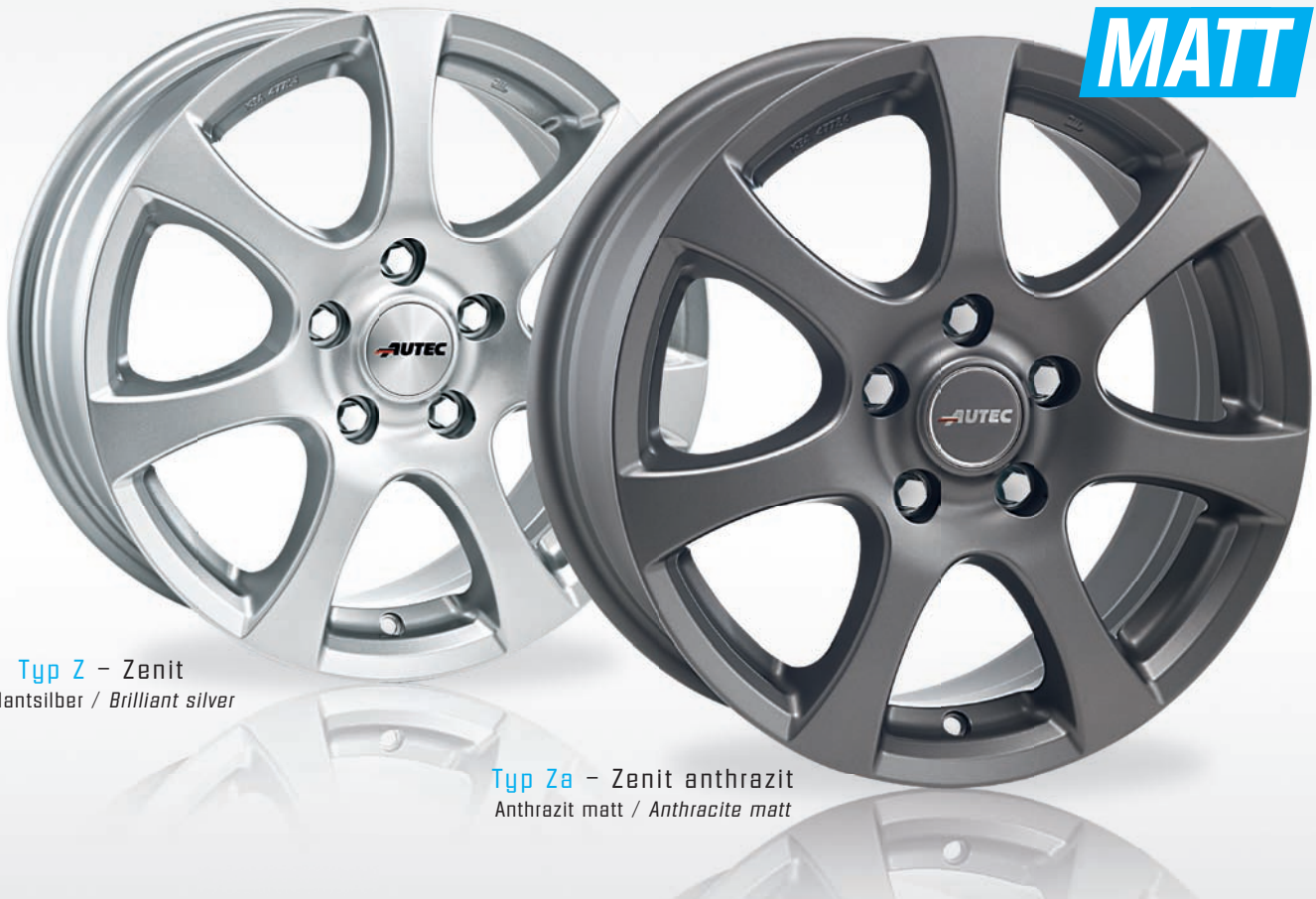
Typ Z – Zenit Brillantsilber / Brilliant silver